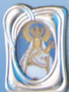
10/02980 4 modelos